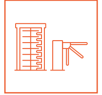
TOEGANG VOOR VOETGANGERS