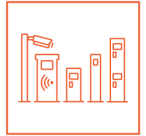
BEDIENINGSZUILEN & PALEN