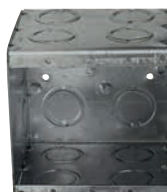
Boîtier d'encastrement compact 6-031208-0007-000