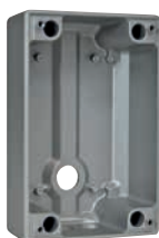
Boîtier applique 6-031208-0004-000