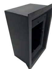
Boîtier d'encastrement 6-031208-0010-000