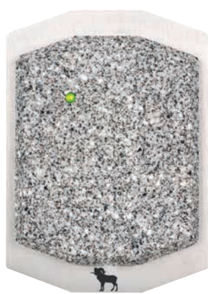
Beschikbaar met of zonder LCD