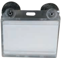
UHF PVC kaarthouder voor voorruit