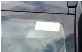
UHF Voorruit label (105x55mm) - incl. sticker