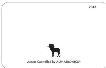
UHF PVC-kaart - 1 kleur geprint